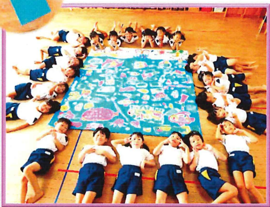
『 魚がすいすい 』