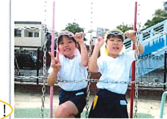
上まで登れるようになったよ!