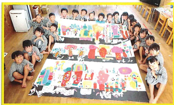
『 木がずらり 』